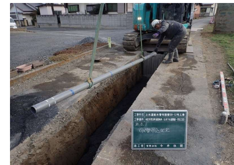
【上水道配水管布設工事】