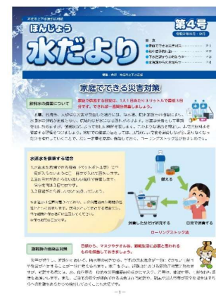
【広報紙「水だより令和2年・第4号、第5号」】