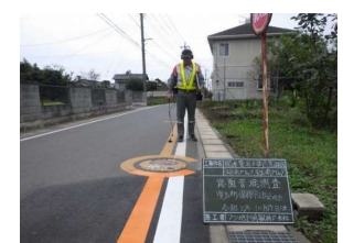
【配水管漏水の復旧工事】