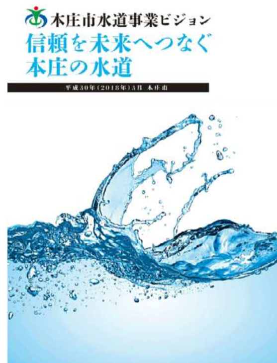
本庄市水道事業ビジョン (平成30年3月策定)

「基本計画」は本市の水道事業を将来にわたって安心かつ安定した水道水を供給し、利用者が満足できる水道事業を継続するための課題に取組むための方針や指標をまとめたもので、平成30年3月に策定しました「本庄市水道事業ビジョン」の基礎となるものです。