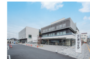
市民活動交流センター (はにぼんプラザ) 【銀座1-1-1】