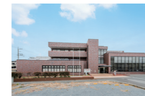
図書館本館【千代田4-1-9】及び児玉分館【児玉町金屋728-2】(2館同名で募集)