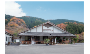
ふれあいの里いずみ亭 【児玉町河内209-1】