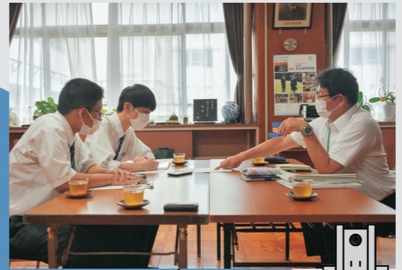
▼7高の校長先生にお話を伺いました (8月)

7月号から特集してきた「七高祭」も、いよいよ大詰め。最終回の今号では、高校生たちが全力で取り組んだ「七高祭2022」を、未公開写真とともにメイキング形式でお届けします。 今年の七高祭は、「広報紙制作」、「PR動画制作」、「仮想空間上での文化部等の発表」の3本立てでお送りします。高校生たちの「今」を感じられるこれらのコンテンツは、間もなく公開予定です。どうぞ、お楽しみに。 ※②、③の視聴方法については、11月15日発行の①広報ほんじょう(別冊版)でお知らせします。