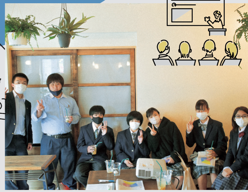
▲七高祭事前説明会 (4月)