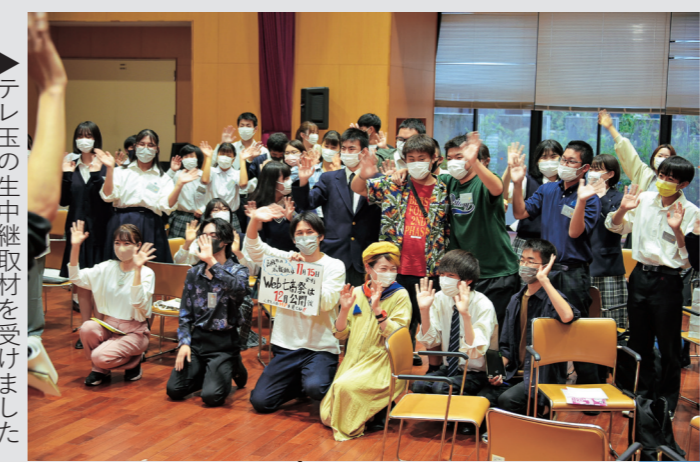
▶テレ玉の生中継取材を受けました (6月)