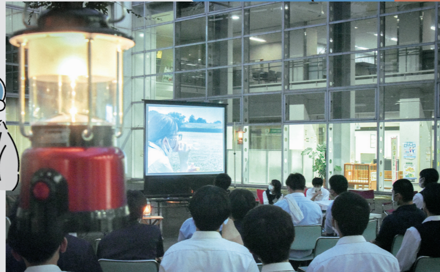
▶利根川河川敷での動画撮影 (7月)

知って、伝えて、関係は深まる 今年の七高祭は、企画メンバーとして総勢50名近くの高校生が集まってくれました。学校も学年も異なり、初めて顔を合わせる方も多く、最初は緊張の面持ちだった高校生たち。ワークショップを重ねるごとに、打ち解け、互いの学校の情報を交換したり、共通の話題で笑い合ったりする姿が見られるようになってきました。 今回参加してくれた高校生たちは、市外から通ってきている生徒が多くいます。「本庄のことをあまり知らない」といった声も聞かれました。それでも、制作が進むにつれて、「本庄にこんなすてきな場所があったんだ」「ここも行きたい、あそこも行ってみよう!」と、まちの魅力や面白さをたくさん見つけてくれました。七高祭を通じて、普段、自宅と学校を行き来するだけでは気が付かなかった場所を知り、話すことのなかった方たちと触れ合い、そしてそれを多くの方に伝える。この経験が、本庄での高校生活を潤す糧となってくれたり、と願っています。