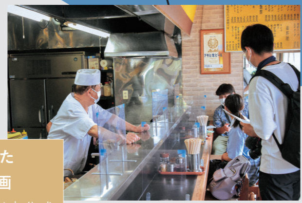
▶中華料理きらくへの取材 (7月)