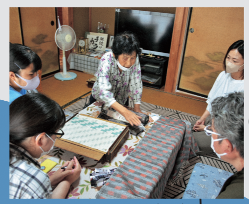
▲古澤織物さんへの取材 (7月)