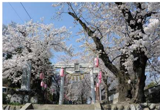
（城山稲荷神社の桜）