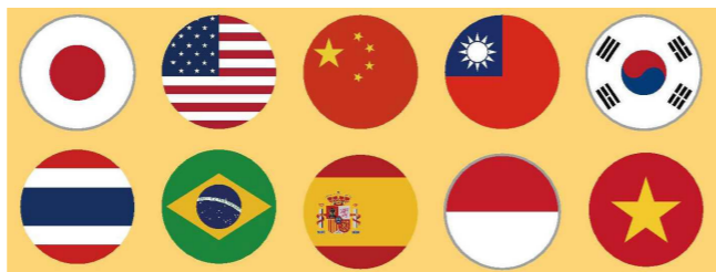
▲ Supported languages (10 languages)