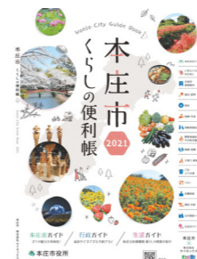
▲作成イメージ(前回作成)

(株)サインックス埼玉北支店 ☎ 0 4 8 - 5 2 5 - 1 4 4 6