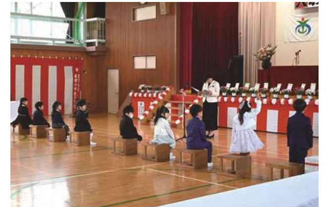
学校生活のスタート

1.5km、6km、ハーフマラソンの部がそれぞれ行われ、合計1,505名のランナーが春の景色を楽しみながらコースを駆け抜けました。