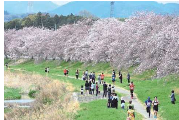
桜咲くコースを楽しみながら走る