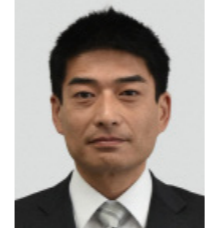
齊藤 邦明氏 (50) 自由民主党 (4期目) ※年齢は、選挙期日(投票日)現在のものです。

4月9日執行の埼玉県議会議員一般選挙(北第2区本庄市・神川町・上里町)は、現職2名以外の立候補の届け出がなく、無投票による再選が決まりました。