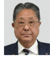
飯塚 俊彦氏 (62) 自由民主党 (3期目)