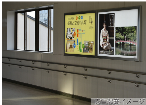
広告掲載イメージ

○広告の内容によっては掲載できない場合があります。市HPをご覧ください。お問い合わせください。