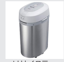
リサイクラー (パナソニック㈱製)