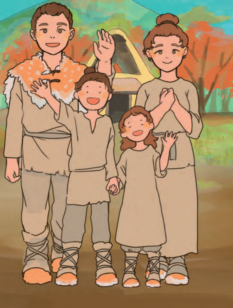
絵画会 西本 直央 作