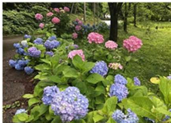
本庄市観光農業センター周辺のあじさい