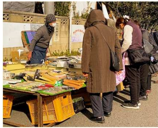
（農工具などを販売する様子）