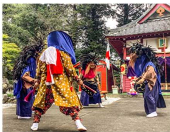
（日枝神社での獅子舞の様子）