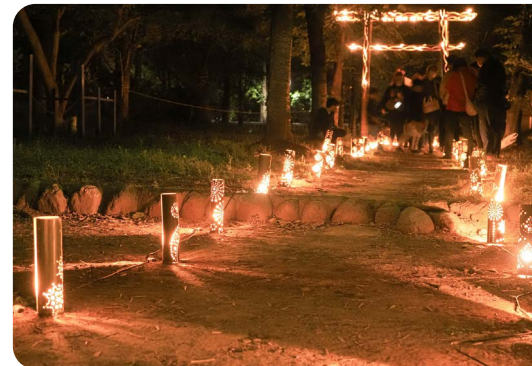
令和5年度あなたのうつす本庄フォトコンテスト受賞作品