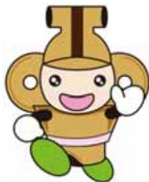
本庄市マスコット「はこぼん」