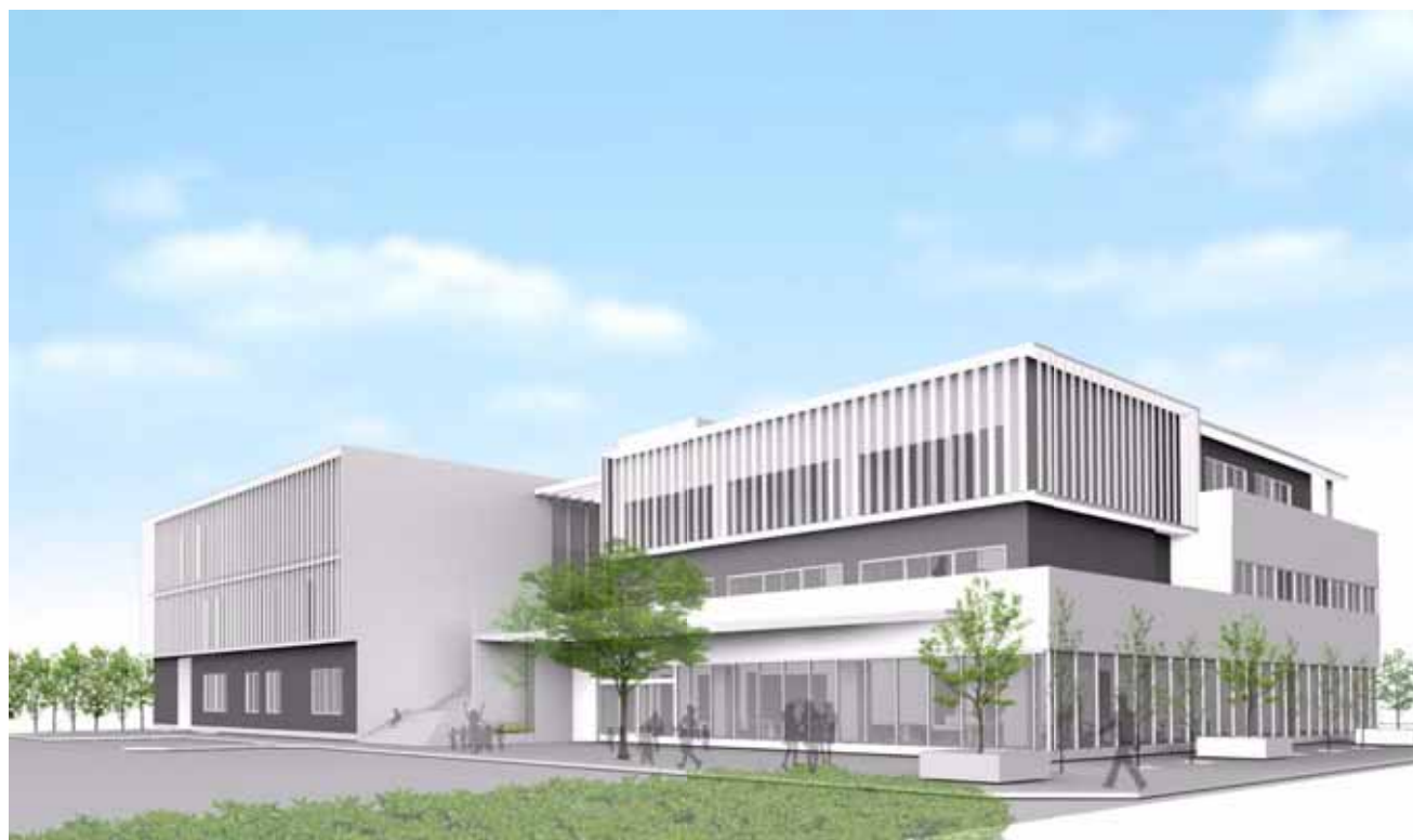
銀座通り踏切方面から見たイメージ図