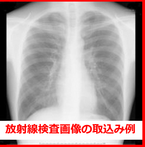
放射線検査画像の取込み例