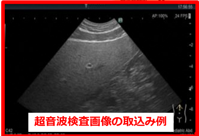
超音波検査画像の取込み例