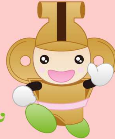
本庄市マスコット