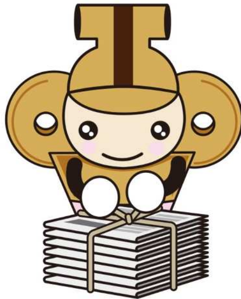
本庄市マスコット はにぼん