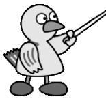
埼玉県のマスコット