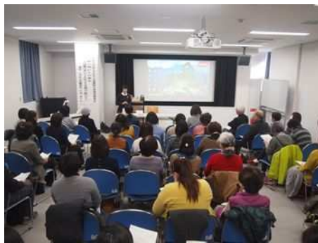
▼読み聞かせボランティア養成講座

ボランティアの新たな人員の確保と読み聞かせ技術向上のため、コロナ禍での中断がありつつも、毎年「ボランティア養成講座」を開催しています。今後の事業拡大を見据え、養成講座の開催回数と会場を見直し、多くの方々の受講を増やすことにより、子どもの読書活動に必要なボランティアの育成・支援を行います。