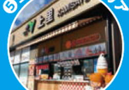
一般道からも利用できる