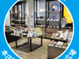
本庄駅直結!情報と交流の広場