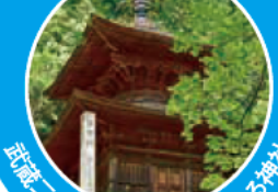
武蔵一宮に数えられる由緒ある神社