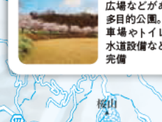
県内でも最も伝統のある梨産地