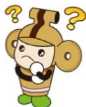
本庄市マスコット はにぼん

また、届出義務に関する規定が「宅地建物取引業法第35条重要事項の説明等」の対象になります。