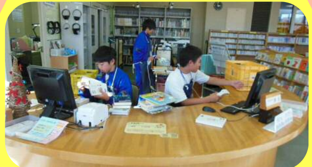
▲児玉中学生によるカウンター業務

カウンターでの本の貸出・返却・配架から、新刊本の受け入れや装備(本を貸出用に加工する作業等)などの処理、また小学校に出向いての移動図書館の貸出など様々な図書館業務を行い、とても丁寧に真面目に取り組んでいました。