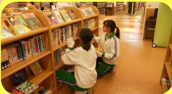
▲本庄西中学生による配架・書架整理

平成29年11月に本庄西中学校の1年生が図書館本館で、12月には児玉中学校の1年生が児玉分館で、それぞれ図書館の業務を実際に体験する社会体験チャレンジを行いました。このチャレンジ学習は、働くことの楽しさや厳しさ、また社会の規律やマナーの大切さを学ぶことを目的に毎年実施しているもので、今年度は本庄西中学校から2人、児玉中学校からは3人の生徒が参加してくれました。