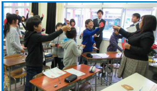
旭小学校【人権教育】

「自他の違いやよさを認め、人とかかわりを大切にする旭っ子の育成～認め合い、支え合い、学び合う力を高める指導～」を研究主題とし、人権感覚育成プログラムを活用した授業研究に取り組みました。