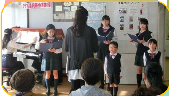
▲藤田少年少女合唱団