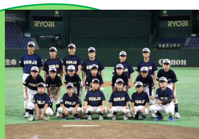
▲6年生本庄選抜チーム(東京ドーム親善試合)