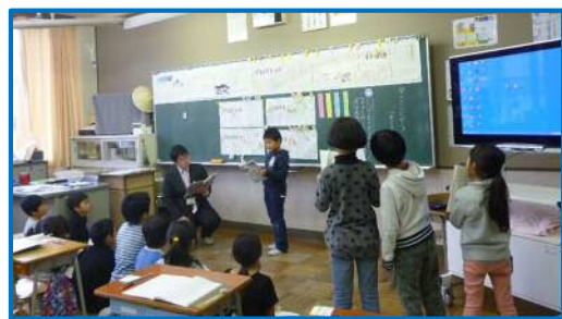
秋平小学校【学力向上】

研究主題を「仲間と関わり合いながら生き生きと主体的に運動に取り組み、自らの体力を高める児童の育成」とし、授業の充実、運動の生活化、望ましい生活習慣の育成を目指して研究に取り組みました。成果として、運動好きな児童が増加し、新体力テスト結果も向上しました。