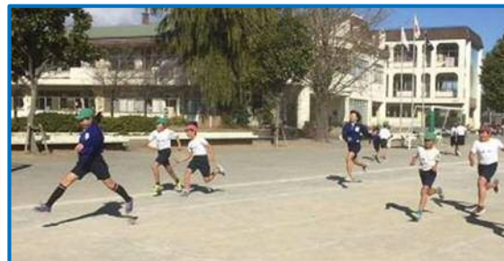
本庄東小学校【体力向上】

「自他の違いやよさを認め、人とかかわりを大切にする旭っ子の育成～認め合い、支え合い、学び合う力を高める指導～」を研究主題とし、人権感覚育成プログラムを活用した授業研究に取り組みました。