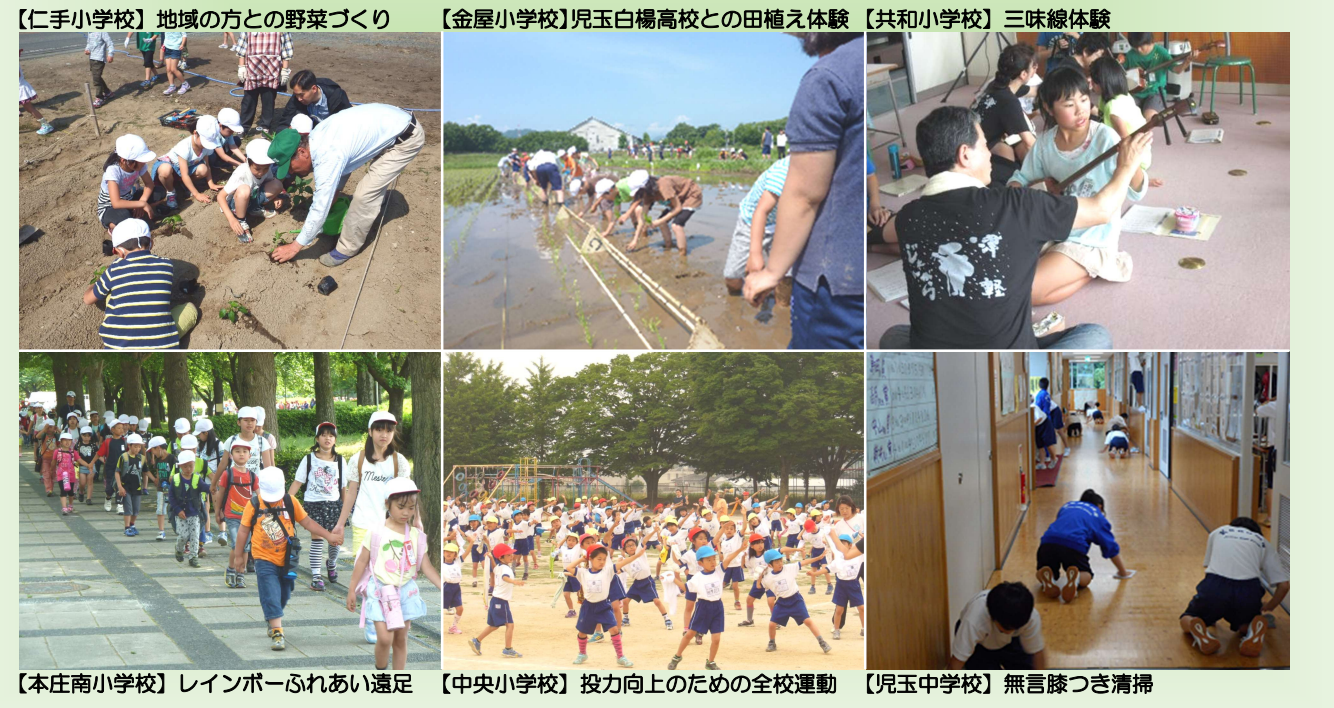
【仁手小学校】地域の方との野菜づくり 【金屋小学校】児玉白楊高校との田植え体験 【共和小学校】三味線体験 【本庄南小学校】レインボーふれあい遠足 【中央小学校】投力向上のための全校運動 【児玉中学校】無言膝つき清掃

市立小中学校では、地域の方々の協力を得て行われる体験活動や各校の特色を生かした学習活動などを通して、楽しく学んでいます。