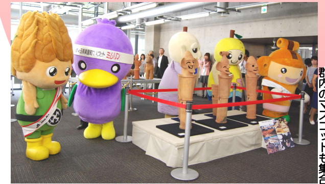
郡内マスコットも集合

7月15日から8月25日まで早稲田リサーチパーク・コミュニケーションセンターで、「児玉地域のはにわ大集合」展が開催されました。この展示会は、早稲田大学と本庄市、美里町、神川町、上里町が共催したもので、期間中、公開講座やギャラリートーク、はにわを作るワークショップなどもあり、小・中・高校生から大人まで、多くの人で賑わいました。オープニングセレモニーには各市町のマスコットが招待され、埴輪をモチーフにした本庄市の「はにぼん」をはじめ、美里町の「ミムリン」、神川町の「神じい&なっちゃん」、上里町の「こむぎっち」も駆けつけ、会場を盛り上げました。