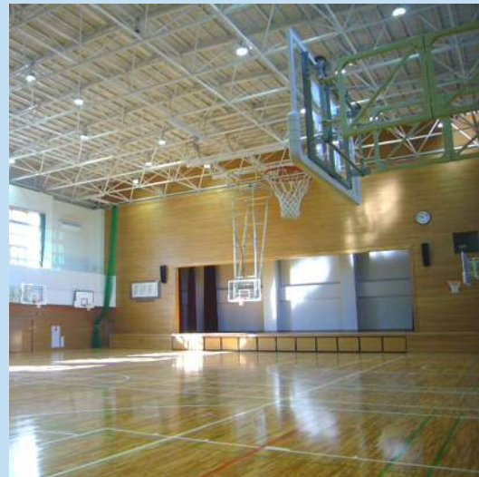
本庄東中学校 新体育館

また、中央小学校体育館の耐震補強工事が完了し、本庄西小学校体育館の耐震補強工事もまもなく完了する予定です。これにより本庄市立小中学校施設の耐震化率は100%となります。