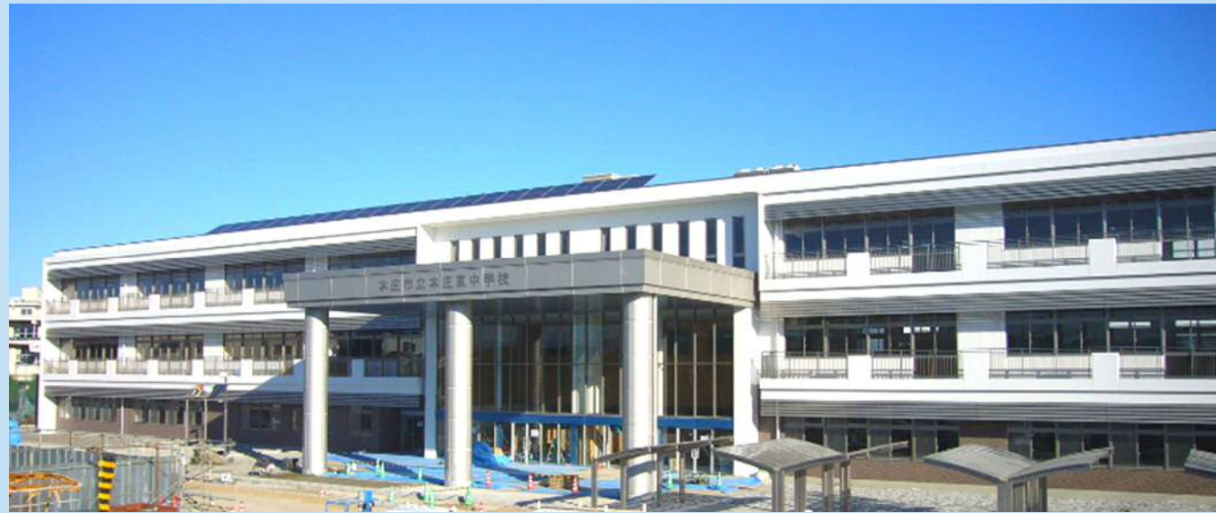
本庄東中学校 新校舎

平成25年7月より始まった本庄東中学校建替工事は、校舎及び体育館が完成しました。今後は、既存校舎の解体、グラウンドの整備、プール棟の建設、外構の整備を行っていく予定です。