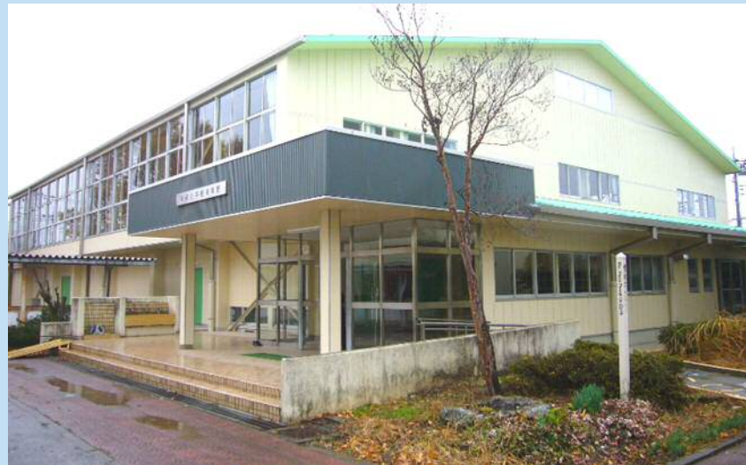
中央小学校 体育館