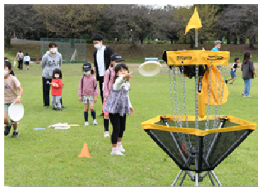
▲フライングディスク