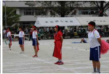
本庄西小学校 全校「応援合戦」