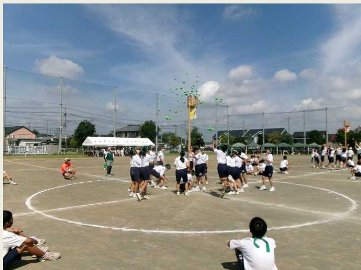
本庄東中学校 2学年「玉入れ」