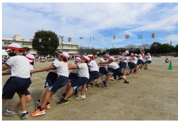
児玉小学校 6学年「綱引き」