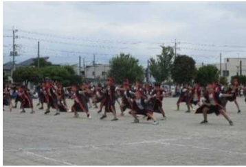
本庄東小学校 中学年「東小ソーラン2023」

各学校において児童生徒が全力で種目に取り組み、参観していた方々から多くの拍手を受けていました。