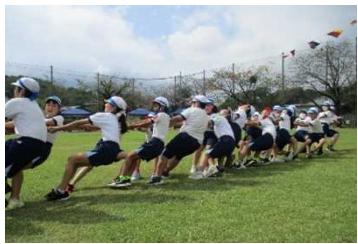
秋平小学校 全校「赤青対抗綱引き」