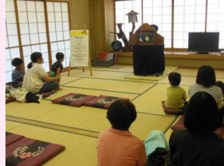
▲おはなしのつどい