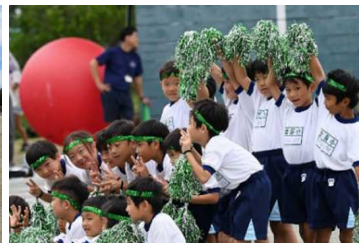
金屋小学校 低学年「リトル金屋っ子」