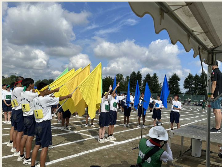
児玉中学校 「開会式」

9月14日(木)の本庄東中学校を皮切りに、各中学校の体育祭が開催されました。全日、天候に恵まれて晴天の中、全力を出して種目に取り組みました。各小学校の運動会の様子は次ページよりお知らせいたします。