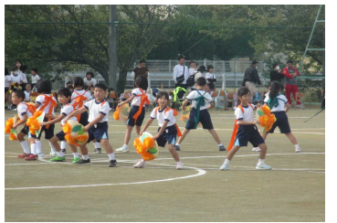
共和小学校 低学年「花笠音頭」