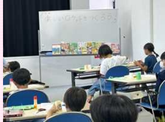
▲夏休み手作り工作教室