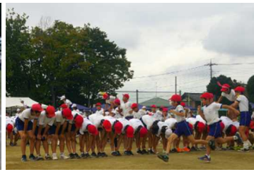
北泉小学校 高学年「かけろ!いなばの白うさぎ」