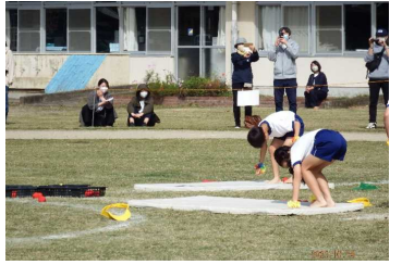
仁手小学校 中学年「目指せ一番星～踊って飛ばして～」