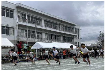
本庄南小学校 「選抜リレー」