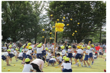
中央小学校 低学年「みんなでフリフリチェッコリ玉入れ」