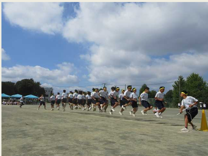
本庄西中学校 1学年「長縄跳び」