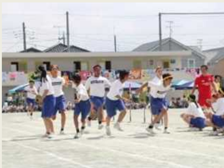
本庄南中学校 3学年「全員リレー」