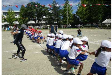
藤田小学校 全校「踊る大綱引き戦!!!」