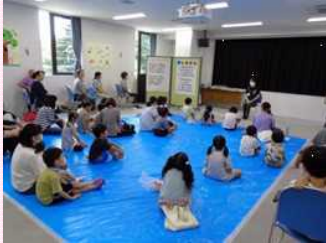
▲夏休みおはなし会

また、7月28日(金)には夏休み手作り工作教室「楽しいロケットをつくろう」を、8月2日(水)には「夏休みDVD上映会」を開催し、こちらもたくさんの方々にご参加いただきました。