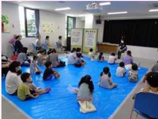
▲夏休みおはなし会

また、7月28日(金)には夏休み手作り工作教室「楽しいロケットをつくろう」を、8月2日(水)には「夏休みDVD上映会」を開催し、こちらもたくさんの方々にご参加いただきました。