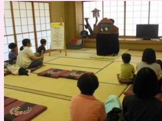
▲おはなしのつどい