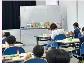
▲夏休み手作り工作教室