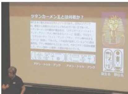
「エジプト考古学入門」 「生きがいの社会学」他5講座