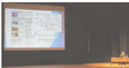
「富岡製糸場と本庄市の絹産業遺産」