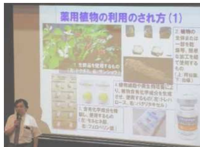
「健康市民大学講座～自然が生み出す薬物～」 「健康市民大学講座～漢方入門と夏の養生～」