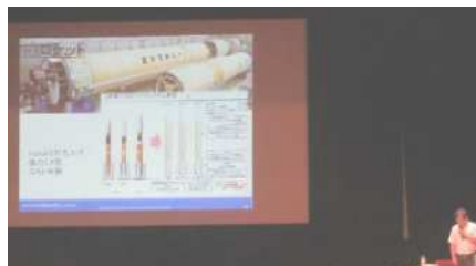
「日本の宇宙開発の歴史とこれから」 「英語コミュニケーション講座」