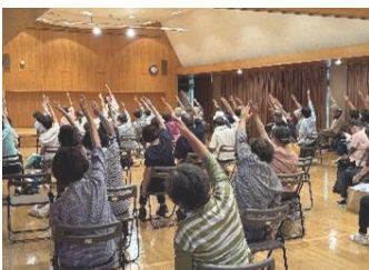
「椅子ヨガで「健幸」に! 2026」