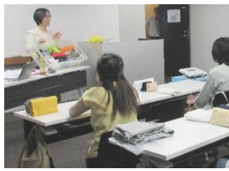
「お片付け入門講座」