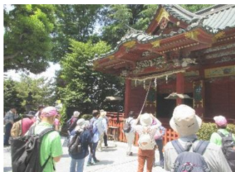
「健康! 歩いて楽習 (がくしゅう) 【本庄方面】」