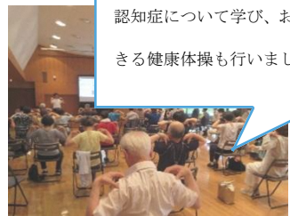
【「あいおいニッセイ同和損害保険 (株) 協力講座】