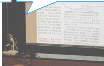
【早稲田大学協力講座】