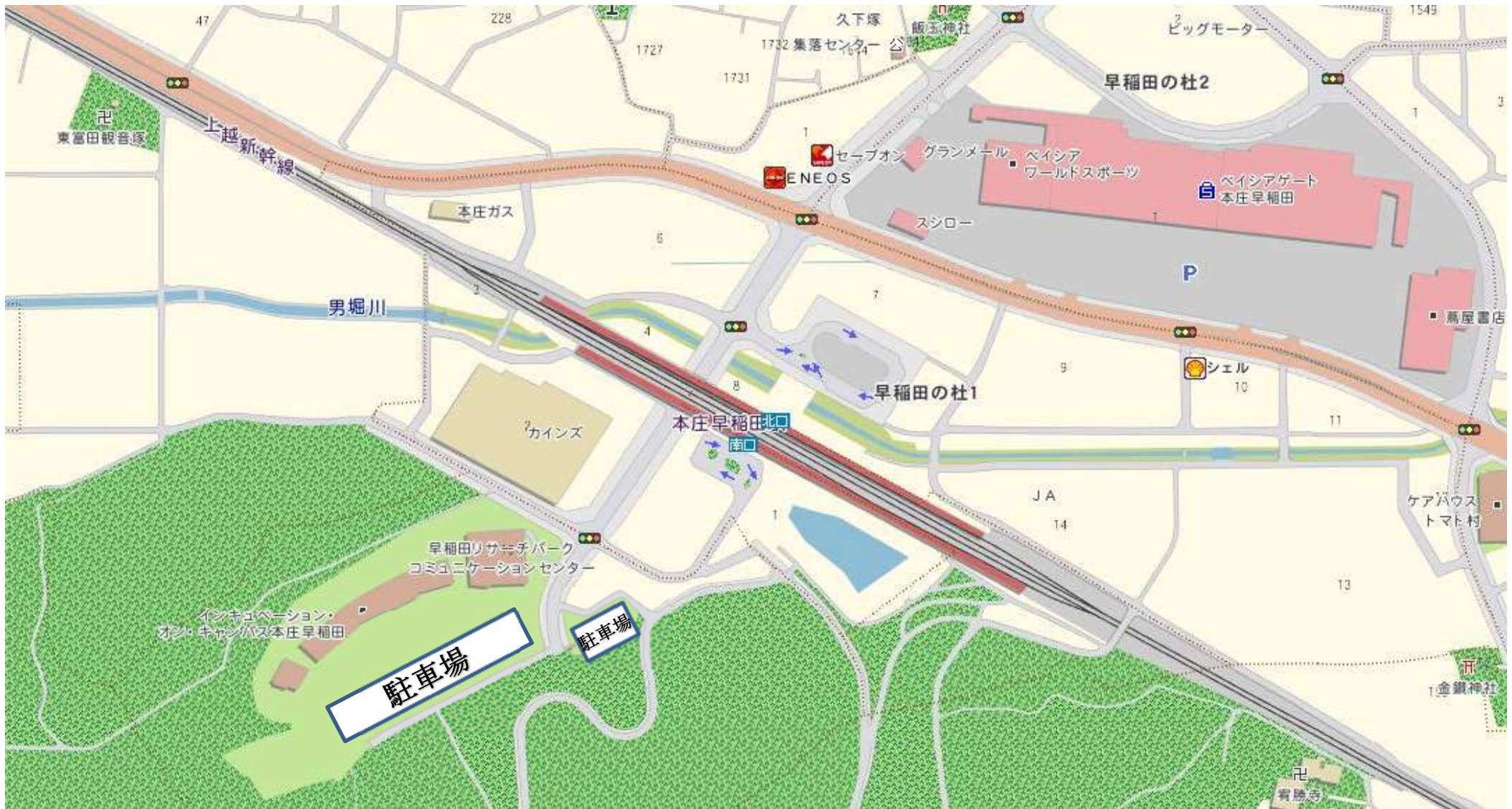
早稲田リサーチパーク・コミュニケーションセンター 〒367-0035 本庄市西富田大久保山1011-3