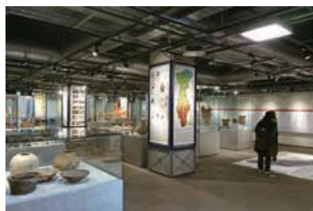
写真 10-1 「本庄早稲田の杜ミュージアム」

[図 10-1]。各施設が価値の理解（学習・体験）や観光拠点（個別の文化財への誘導）を担い、相互連携による総合的展示体制（ネットワーク化）を整えるため、「3-④ 歴史文化解説拠点施設検討事業」を重点施策として位置づけます。