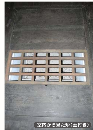
室内から見た炉（蓋付き）