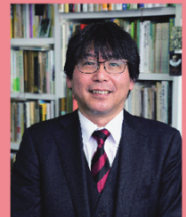
「早稲田学報」2025 年 6 月号より 撮影＝小泉賢一郎