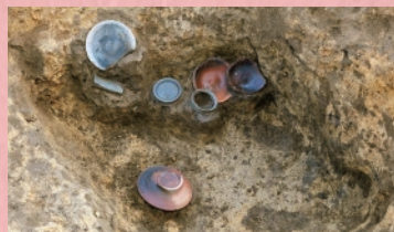
きたほりしんでんいせき 北堀新田遺跡