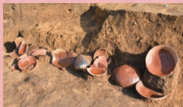
おしましきりざわみなみいせき 小島仕切沢南遺跡