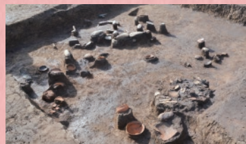
あさひ おしまこふんぐん 旭・小島古墳群