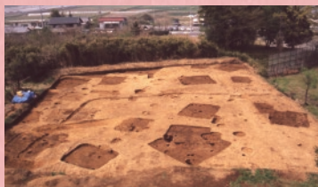
びわばしいせき 枇把橋遺跡

本庄市は遺跡の宝庫。昨年もたくさんの発掘調査を行いました。 その中から5遺跡をご紹介します。採れたて発掘情報をお届けします！