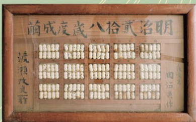
写真 左上：繭市場の風景 左中：糸繭卸売商木札 左下：繭額 右上：競進社本社伝習所 右下：競進社養蚕改良法案 (左上：本庄市立図書館蔵、それ以外本庄市蔵)

本庄早稲田の杜ミュージアム HON70-WASEDA NO MORI MUSEUM