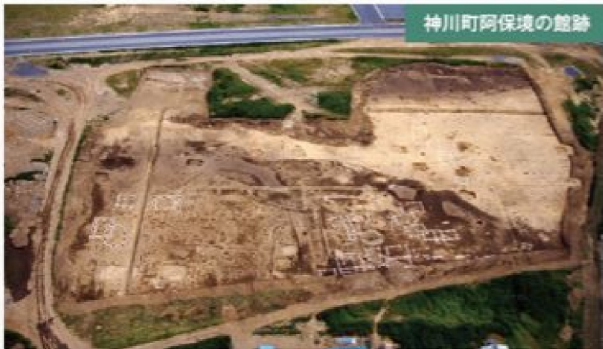
神川町阿保境の館跡