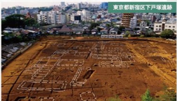
東京都新宿区下戸塚遺跡