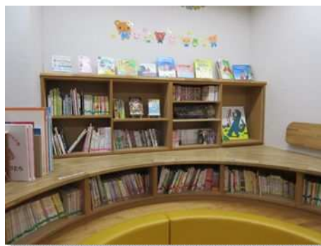
▼児童センター 図書室

児童センターの図書室は、遊びに来た子ども達や親子連れの方達が気軽に利用できる場所であることから、楽しく読書ができるよう図書の充実を図ります。また、「つどいの広場」や「子育て講座」で絵本等の活用や読み聞かせを行い、市立図書館と児童センターで情報交換等を行い、子育て支援団体との連携のもと、児童センターでの読書活動を推進します。