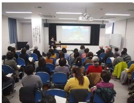
▼読み聞かせボランティア養成講座

ボランティアの新たな人員の確保と読み聞かせ技術向上のため、コロナ禍での中断がありつつも、毎年「ボランティア養成講座」を開催しています。今後の事業拡大を見据え、養成講座の開催回数と会場を見直し、多くの方々の受講を増やすことにより、子どもの読書活動に必要なボランティアの育成・支援を行います。