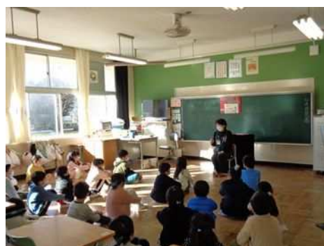
▲小学校での「出張おはなし会」

また、「ストーリーテリング」、「朗読会」を実施し、子どもが本や読書に親しむ機会を広げます。