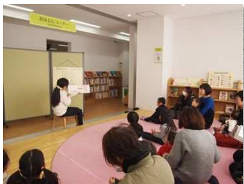
▲おはなしコーナーでの「おはなし会」

「中高生活動室」は、コロナ禍により利用中止を余儀なくされましたが、中高生向けの活動展示や情報収集に利用できること等をPRし、来館のきっかけとなる魅力ある場にしていきます。