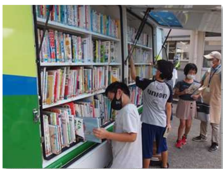
▲移動図書館車「ほきいち号」巡回中

さらに、「出張おはなし会*」は、対象学年や内容の拡充を図り、総合学習・チャレンジ学習における市立図書館の見学や中高生の職場体験を積極的に受け入れて、子どもに市立図書館と読書の魅力を伝えていきます。多くの子どもが市立図書館に足を運び、楽しんでもらえるようなイベントとして「工作教室」や「クリスマス会」、「DVD上映会」等を、季節ごとに開催します。