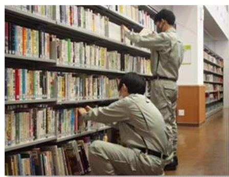
▲高校生の就業体験の様子