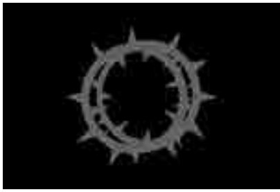
大正11年全国水平社荊冠旗

また、人権教育研修会以外にも、人権教育に関する講演会を年2回、市民文化会館と児玉文化会館セルディを会場に開催しております。さらに人権相談事業として、人権擁護委員による月2回の人権相談の実施や、小中学校からの依頼による人権教室、街頭啓発活動等を行っております。本市の人権行政におきましては、同和問題も含めたあらゆる人権問題の解決に向けて、人権教育や啓発活動を積極的に実施しております。