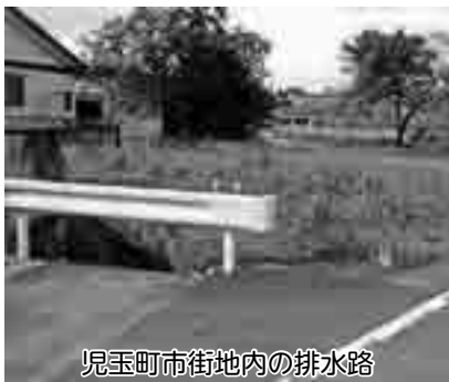
児玉町市街地内の排水路

答 市内の道路や水路等の危険箇所への解消に向けて、市内全域で業務委託や職員によるパトロールを実施し、危険箇所の発見に努めています。危険箇所を発見した場合は、早急に応急的な安全措置を行い、適切な修繕等の計画を検討し、その後に修繕等の計画に基づき工事を発注しています。