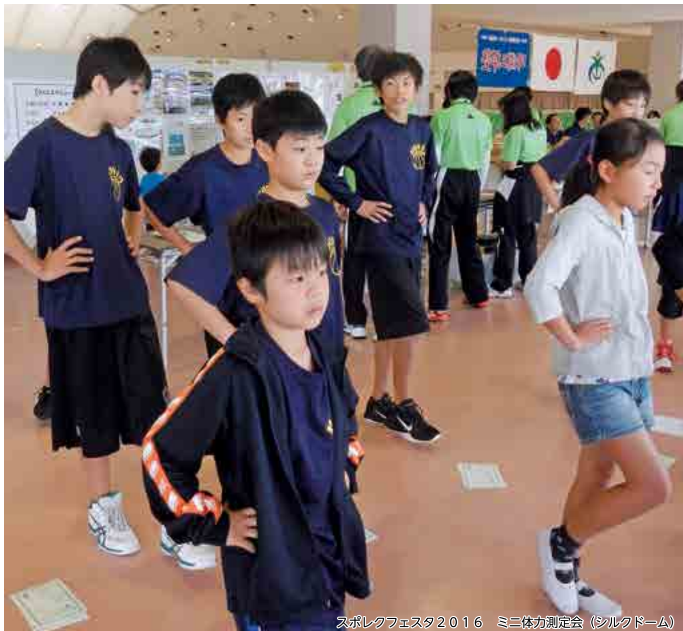
スポレクフェスタ2016 ミニ体力測定会 (シルクドーム)