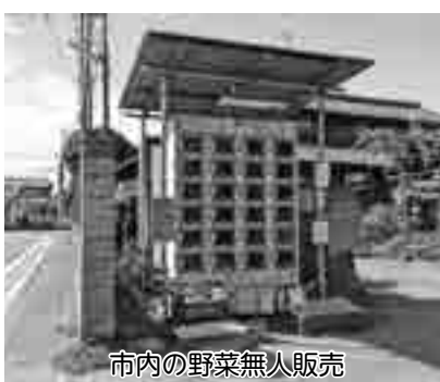
市内の野菜無人販売