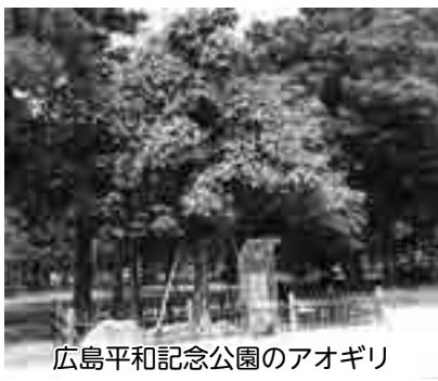
広島平和記念公園のアオギリ