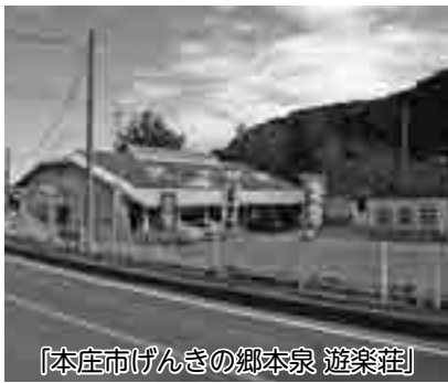
「本庄市げんきの郷本泉 遊楽荘」