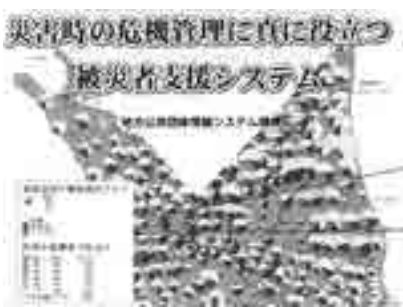
被災者支援システム 他市の例