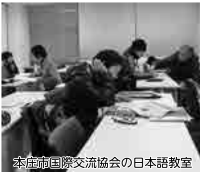
本庄市国際交流協会の日本語教室