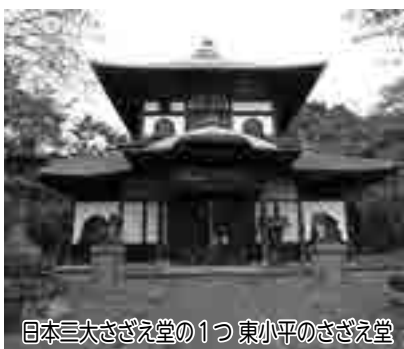
日本三大さざえ堂の1つ 東小平のさざえ堂