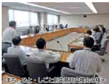
まち・ひと・しごと創生意見交換会の様子

め方、人口減少問題への対応などについて、様々な角度から活発な議論が交わされました。