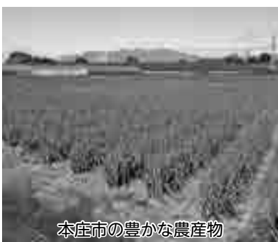
本庄市の豊かな農産物

【その他の質問】 ・本庄市都市計画マスタープランに於けるコンパクトシティ構想について