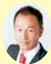
広瀬 伸一 議員