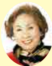
明堂 純子 議員