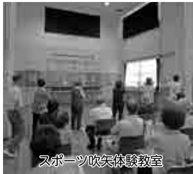
スポーツ吹矢体験教室

答 公民館は、多様な生涯学習や集会の場の提供など、住民の日常生活に最も身近な生涯学習の拠点施設として、役割を果たしております。平成26年度の実績では、公民館は、2箇所の中央公民館と地区公民館が10館の計12館あり、各公民館の登録クラブは、合計で293団体、3802人でした。内訳としては、本庄市中央公民館が34団体、児玉中央公民館