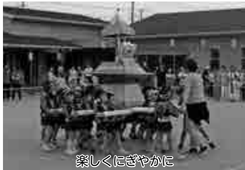
楽しくにぎやかに

の分析等を示す地方人口ビジョンと、政策目標や施策を取りまとめた地方版総合戦略を作成します。市では、実効性の高い総合戦略を打ち立て、計画的に実施することで更なる成長につなげたいと考えています。