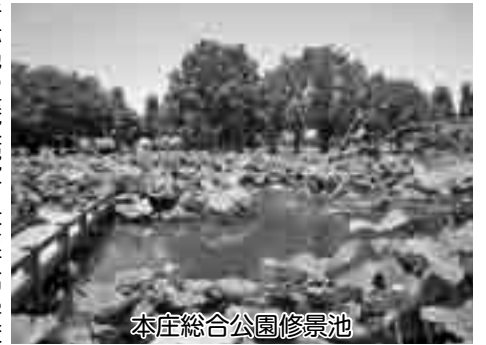
本庄総合公園修景池

候変動に対応したモデル都市本庄を実現する。実現した気候変動対応型のモデル都市本庄を国内外の「シヨールーム」にすると構想している。市民プラザと児玉総合支