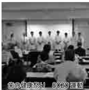
歯の健康祭り 8020運動