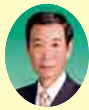
岩崎 信裕 議員