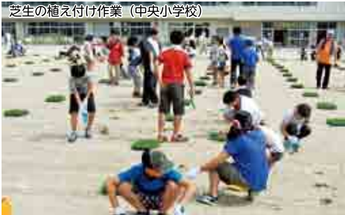
芝生の植え付け作業 (中央小学校)