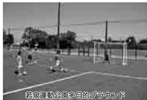
若泉運動公園多目的グラウンド