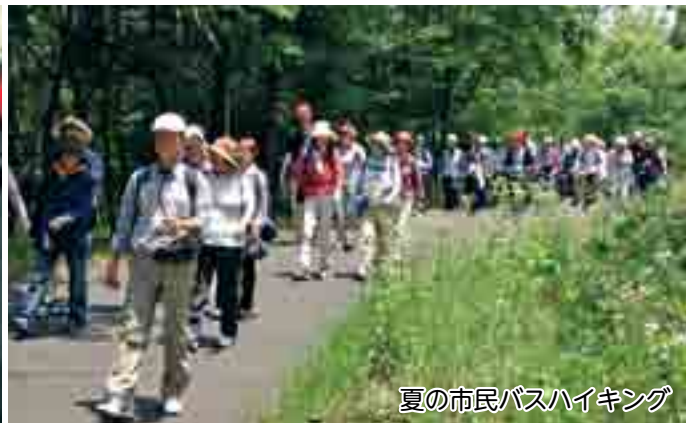
夏の市民バスハイキング