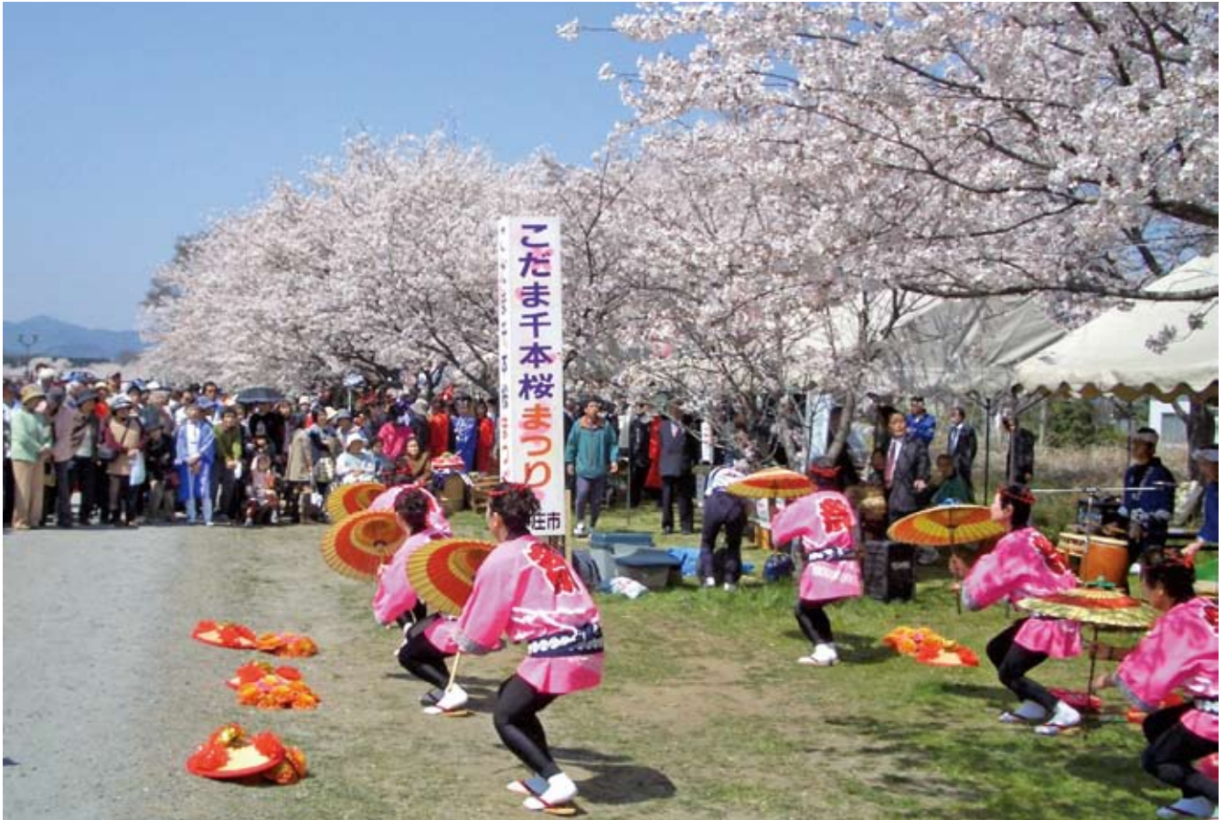
満開の桜と賑やかさを競う「こだま千本桜まつり」～小山川河畔～