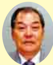
山口 薫 議員