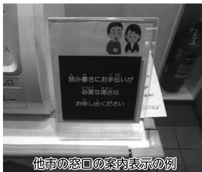
他市の窓口の案内表示の例

視覚障害のある方や視力の低下した高齢者など、多くの方が日常生活において読み書きに支援を必要としている状況であると認識しています。そのため、外出時にヘルパーが代読・代筆等も行う「同行援護」による支援があり、現在、10名の方が利用しています。代読・代筆を担う奉仕員制度の導入には、人材の育成方法や奉仕員を活用するための