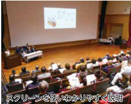
スクリーンを使いわかりやすく説明