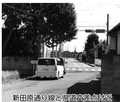
新田原通り線と県道交差点付近

都市の骨格を形成する重要な都市施設である都市計画道路は、長期的な視点に立って定められるため、整備には相当程度の時間を要します。したがって、単に未着手というだけで変更することは適切ではありませんが、社会状況の変化や地域整備の状況等を踏まえて、検証・見直しをなされるべきと考えています。児玉地域の路線については、平成26年度より、県