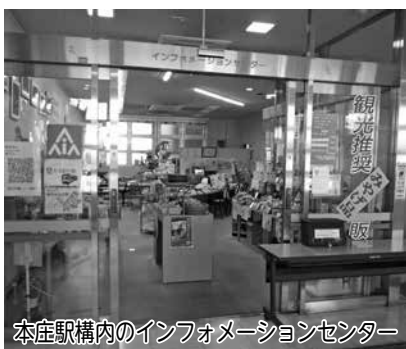
本庄駅構内のインフォメーションセンター