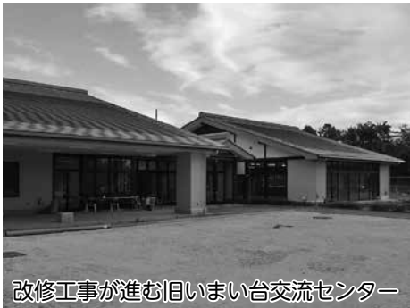
改修工事が進む旧いまい台交流センター

◆本庄市障害福祉センター設置及び管理に関する条例の一部を改正する条例 本庄市障害福祉センターの移転に伴い、施設の位置を変更し、利用時間等を明記するための条例改正です。旧いまい台交流センターが改修され、障害福祉センターとなります。条例の施行日は平成29年11月27日（移転後の障害福祉センターの開所予定日）です。