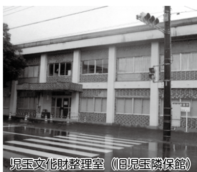
児玉文化財整理室（旧児玉隣保館）

・2016年12月16日公布・施行の「部落差別解消推進法」と「部落差別解消のための施策の推進について」市内小中学校のトイレ改修について