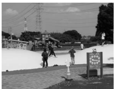
本庄総合公園の「わんぱーく」

答 本庄総合公園の整備は、県道からの新たな出入口と、調整池を兼ねた駐車場等の整備を行い、水遊び場や拡張予定地の整備等を皆様からのご意見を伺いながら進めたいと考えています。また、ご要望の多かったわんぱーく内のトイレの新築工事は、今年度中に完成予定です。県道花園本庄線と本庄総合公園の入口部分の接続については、形状等の検討を行います。