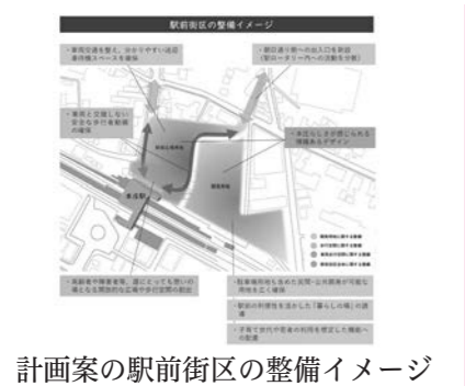
計画案の駅前街区の整備イメージ

【その他の質問】 ・GOTO本庄について 本市においては、3回目の接種券を医療従事者に対して11月に、一般市民を対象に1月から順次発送します。前回は一斉発送でしたが、今回は対象者に順次発送するので、予約枠を調整して混乱を生じないように準備しています。今後11歳以下の接種も予定されていますが、まだ薬事承認前であり、実施の際は国・県の指示に基づき十分な体制のもとに進めていきます。また、異なるワクチンの接種に關しても国の十分な説明がなく、市民が安心して接種するにはまず国からの丁寧な説明が必要であると考えています。本市は全希望者が安心して接種できるように、今後の予約接種体制の整備に努めます。