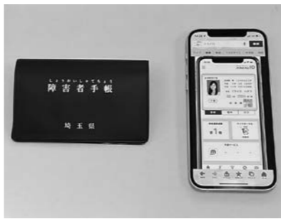
障がい者手帳アプリ