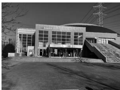
ネーミングライツ第2号

答 市税等の目標値の設定に関しては、前年度の収納率や収納額を上回るように、あるいは前年度の収入未済額を下回ることを目標として徴収に向けた努力をしています。自動販売機の入札による設置は競争性が働く有用な方法と考えており、庁舎やほにぼんプラザ等の需要の高い施設を中心に入札による設置をしています。一方、設置経緯や