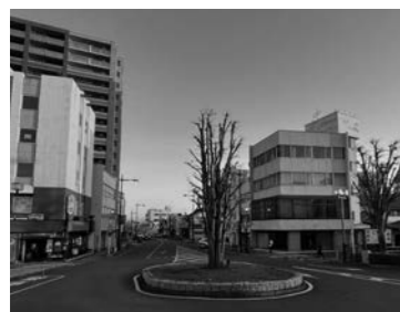
本庄駅北口ロータリー

本計画は、パブリックコメントの結果を周知した後、今年度内に公表し、速やかに事業化に向けた検討業務に着手してまいります。まちの将来像と具体的な整備に言及した初めての計画なので、今後適宜、情報の開示、市民との意見交換をしながら着実に進めていきたいと考えています。