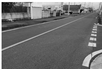
車道と歩道の段差の大きい、危険な歩道