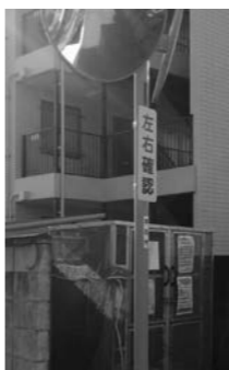
カーブミラーとじん芥収集所