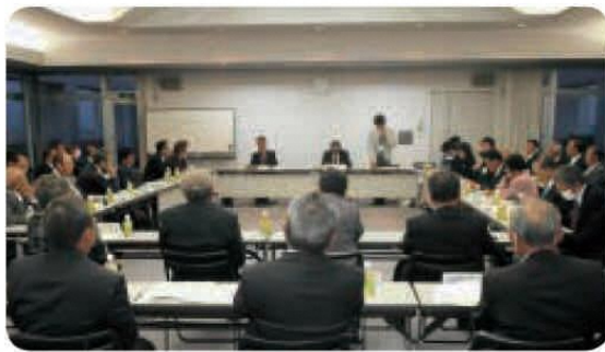
農業委員会総会の様子（昨年撮影）

また、地域農業の経営改善支援のため、農業の担い手の育成や働きかけを行い、農業の環境改善に取り組んでいます。