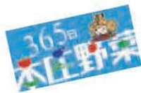
車両用 PR マグネット

本庄市有機100倍運動推進協議会は、農業者団体、農家組合、JA、埼玉県、本庄市等で構成された団体です。安全・安心で高品質な農産物の産地を育成するため、環境にやさしい農業の推進及び本庄産農産物の普及の推進を目指して活動しています。