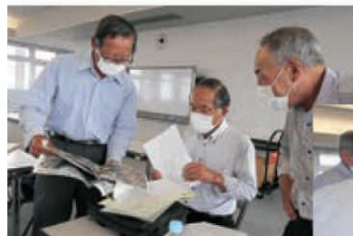
農地パトロールについての会議の様子